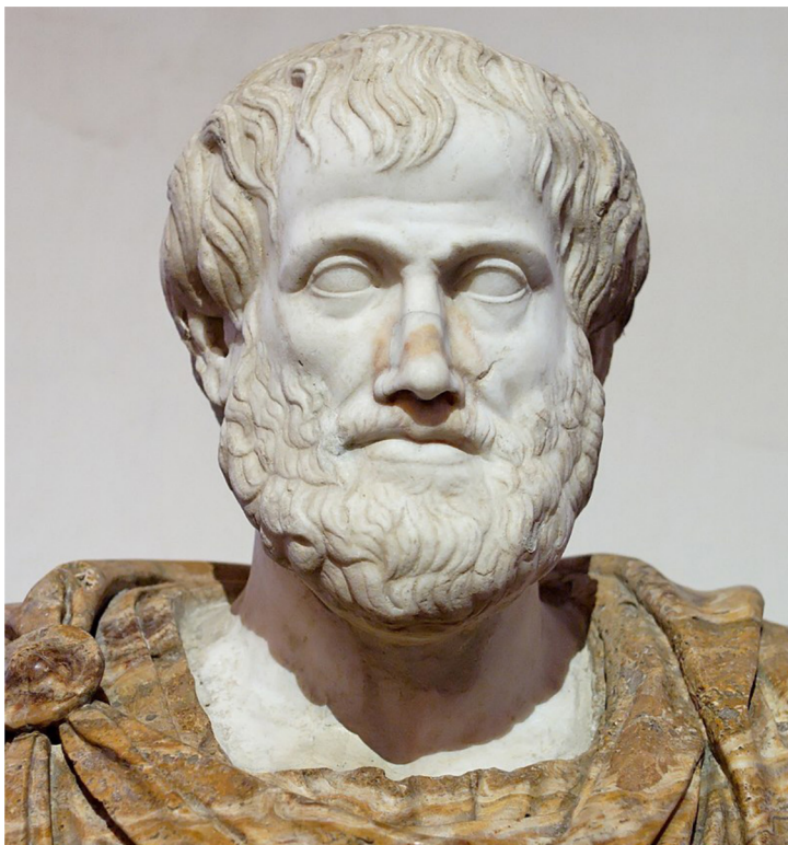
Aristoteles anses vara den viktigaste tänkaren inom den retoriska traditionen.

Koppla samtliga resonemang till grundläggande retoriska begrepp.