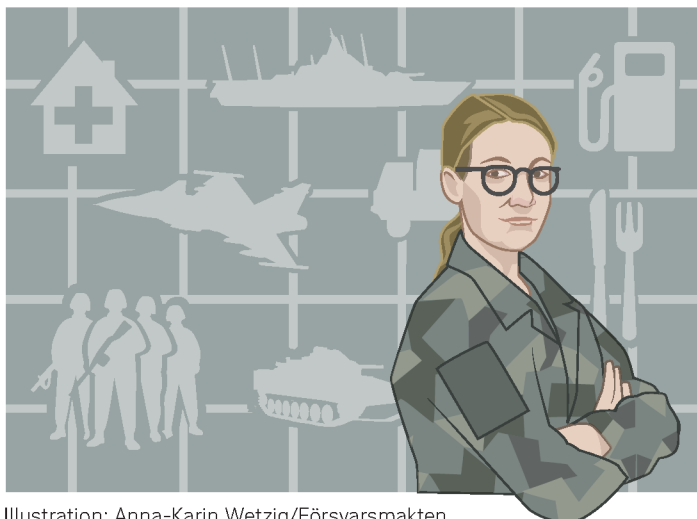
Illustration: Anna-Karin Wetzig/Försvarmakten

Diskutera orsakerna och konsekvenserna samt ge möjliga lösningar på dessa. Det kan handla om att visa förståelse för hur samhället och individen delar ansvar för krisberedskap, samt ge argument för olika sätt att se på frågor, samt värdera andras ståndpunkter utifrån den information som finns.