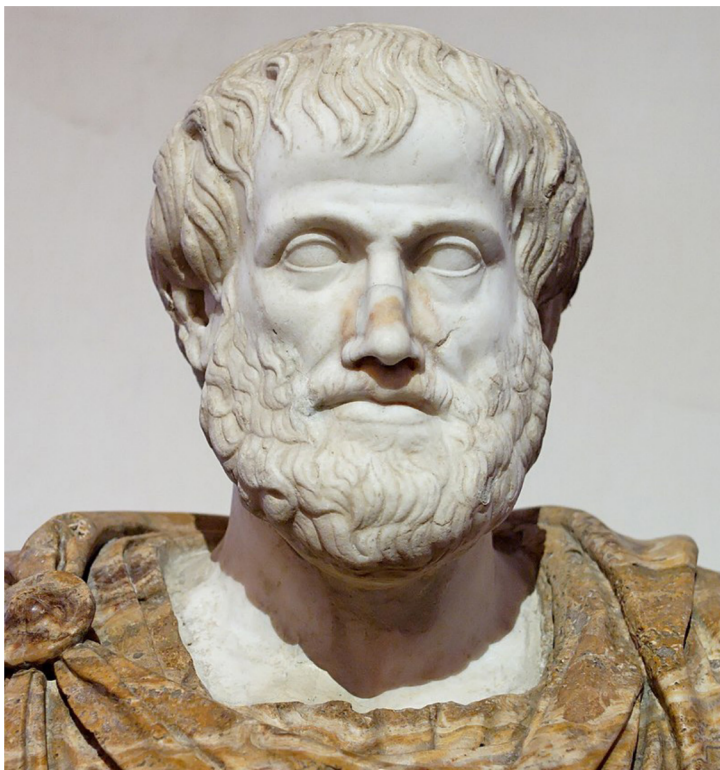
Aristoteles anses vara den viktigaste tänkaren inom den retoriska traditionen.

Koppla samtliga resonemang till grundläggande retoriska begrepp.